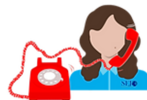
Atención a clientes

Te otorgamos capacitación para tu equipo de trabajo, dentro de nuestras instalaciones, directamente en tu lugar de trabajo o vía remota (videollamada)