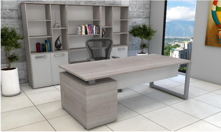
LIBREROS Y CREDENZAS