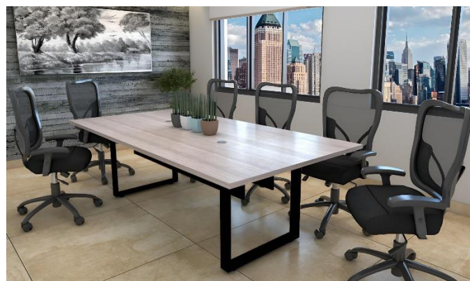
MESAS DE JUNTAS