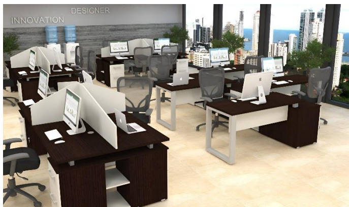
CENTROS DE TRABAJO