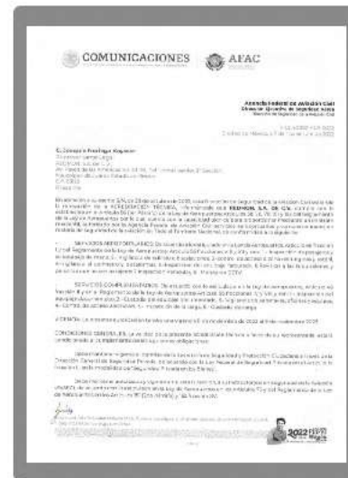
Acreditación técnica de la AFAC (Agencia Federal de Aviación Civil).