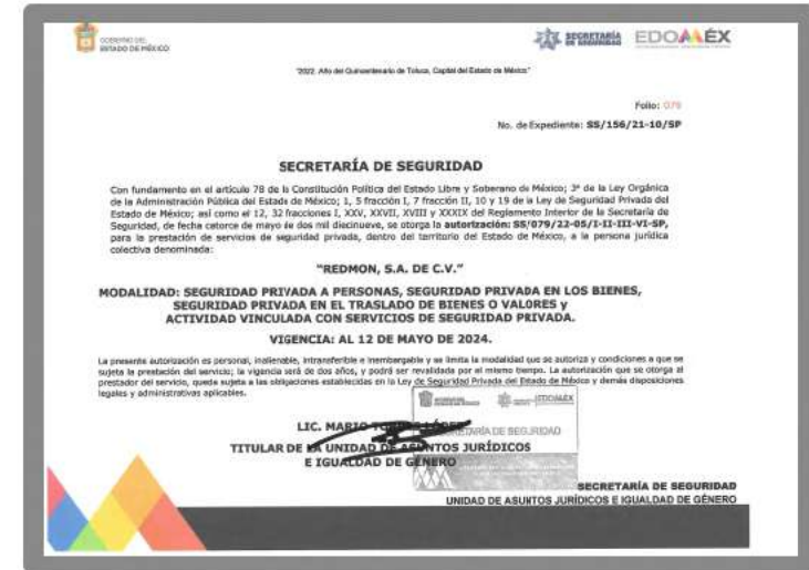
PERMISO ESTADO DE MÉXICO SS/156/21-10/SP