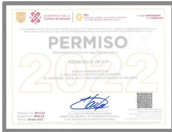
PERMISO CDMX 0915-22