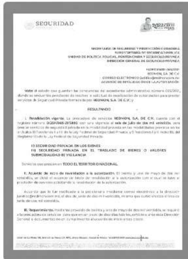
PERMISO FEDERAL DGSP/065-21/3892